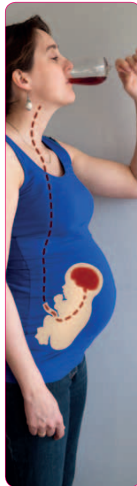
Als je alcohol drinkt, drinkt je baby mee.