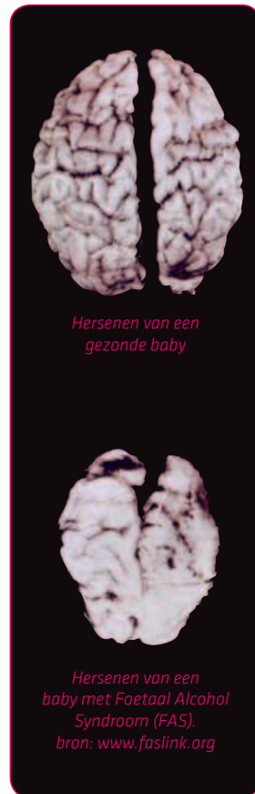
Hersenen van een gezonde baby